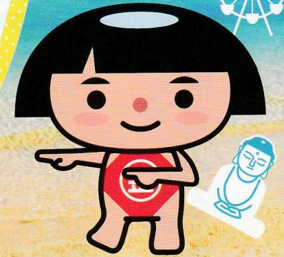
神奈川県PRキャラクター かながわキンタロウ